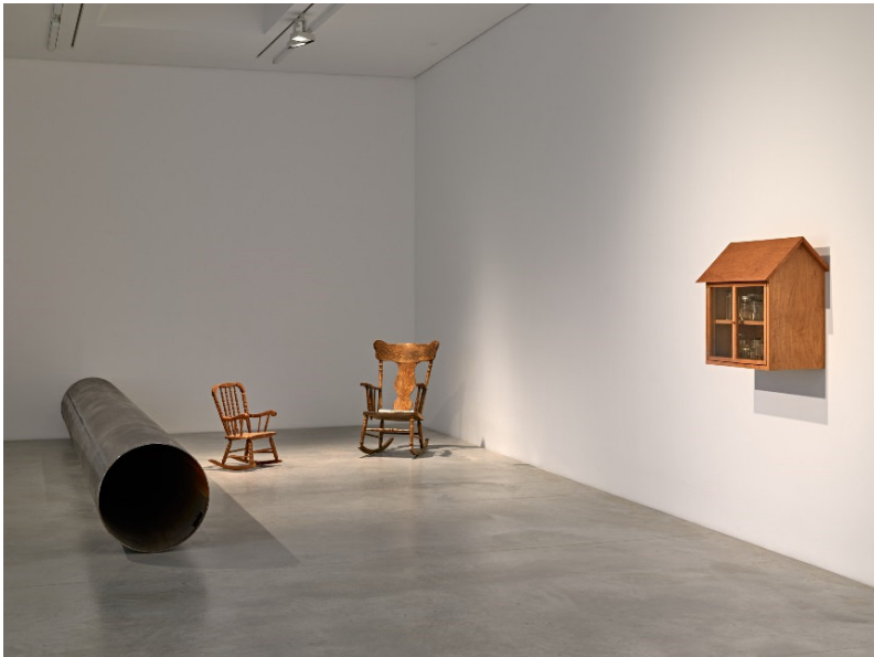
Ausstellungsansicht Sung Tieu, Infra-Specter, 2023, Amant, New York, 2023