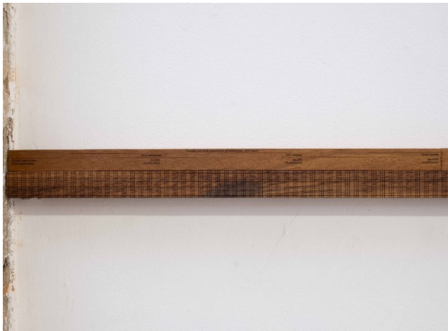
Sung Tieu, The Ruling (Population of Indochina), 2023, Ausstellungsansicht Ordet, Mailand, 2023