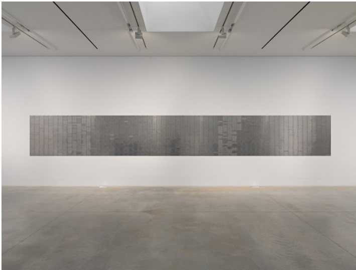
Sung Tieu, Mural for America, 2023, Ausstellungsansicht Amant New York, 2023, Courtesy die Künstlerin und Amant N.Y., Foto: New Document