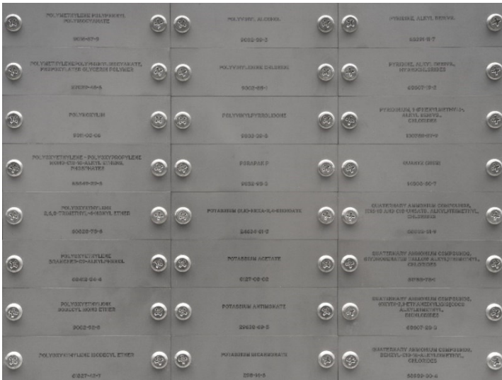
Sung Tieu, Mural for America, 2023, Courtesy die Künstlerin, Emalin, London, Galerie Sfeir-Semler, Hamburg und Galerie Trautwein Herleth, Berlin, Foto: New Document