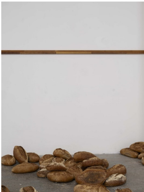
Ausstellungsansicht, Sung Tieu, The Ruling, Ordet, Mailand, 2023, Courtesy die Künstlerin, Ordet, Mailand und Galerie Trautwein Herleth, Berlin, Foto: Nicola Gnesi