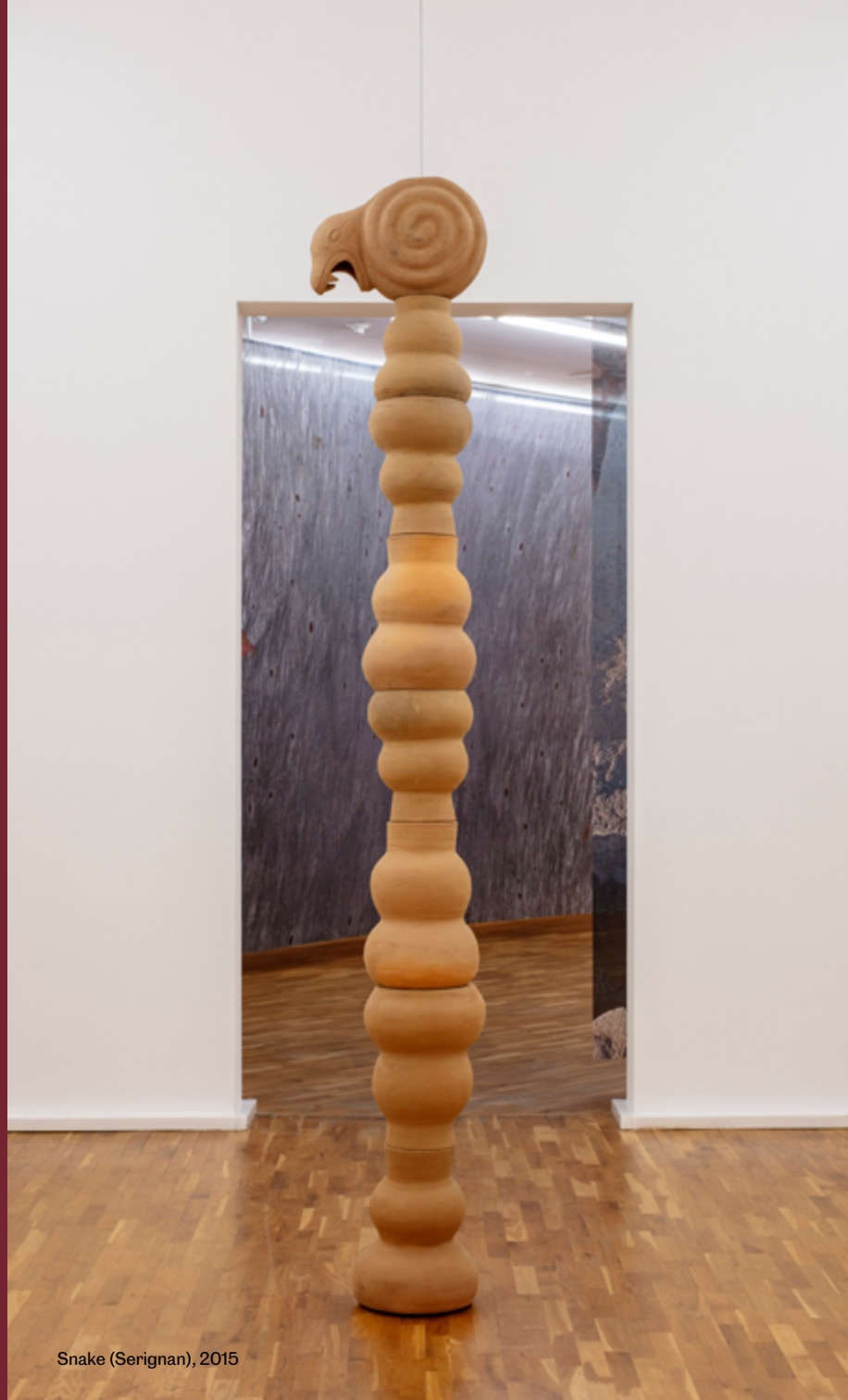
Snake (Serignan), 2015