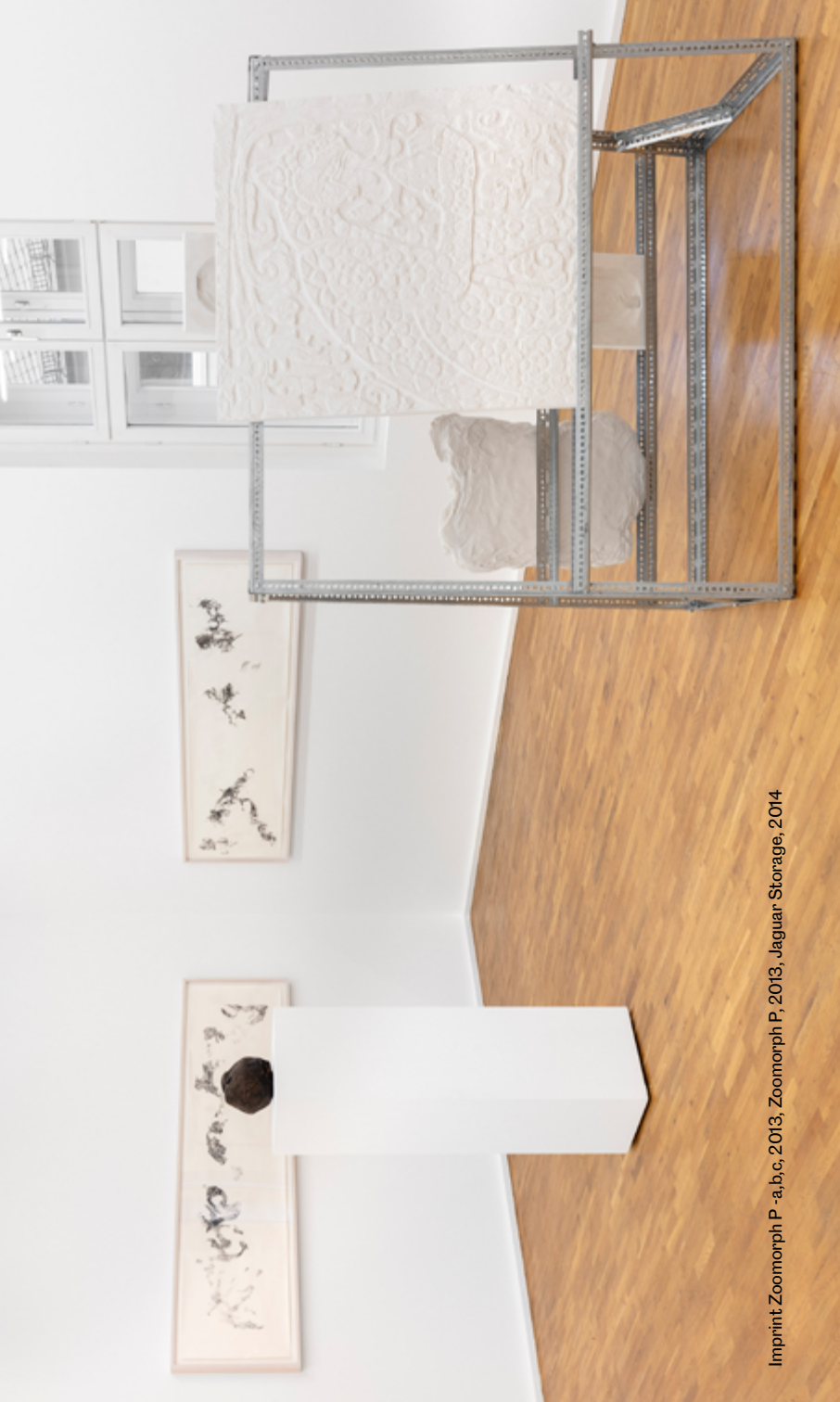
Imprint, Zoomorph P - a,b,c, 2013, Zoomorph P, 2013, Jaguar Storage, 2014