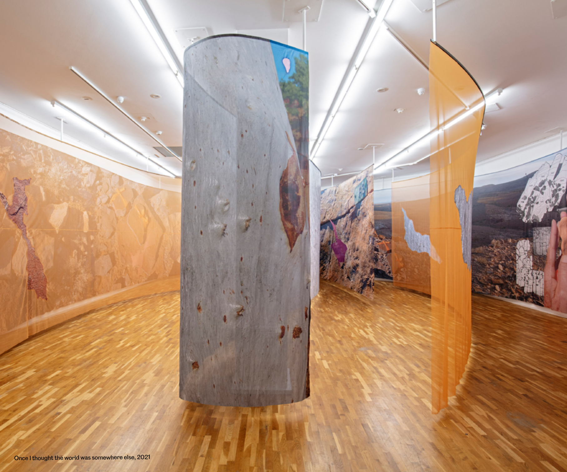
Once I thought the world was somewhere else, 2021