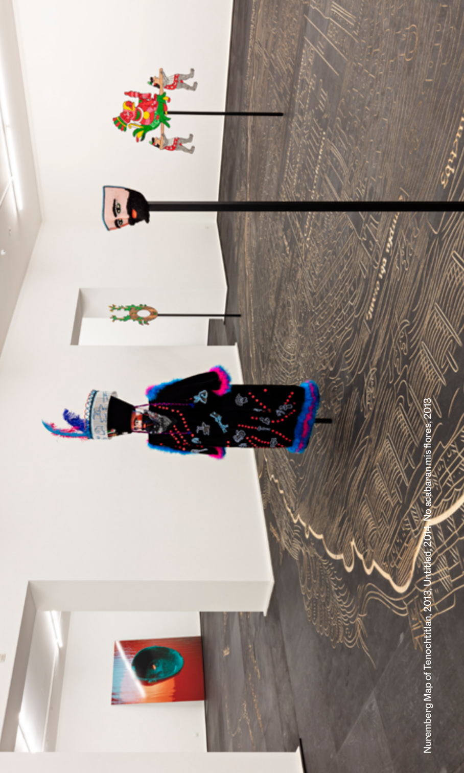
Nuremberg Map of Tenochtitlan, 2013, Untitled, 2014, No. acabaram mis flores, 2013