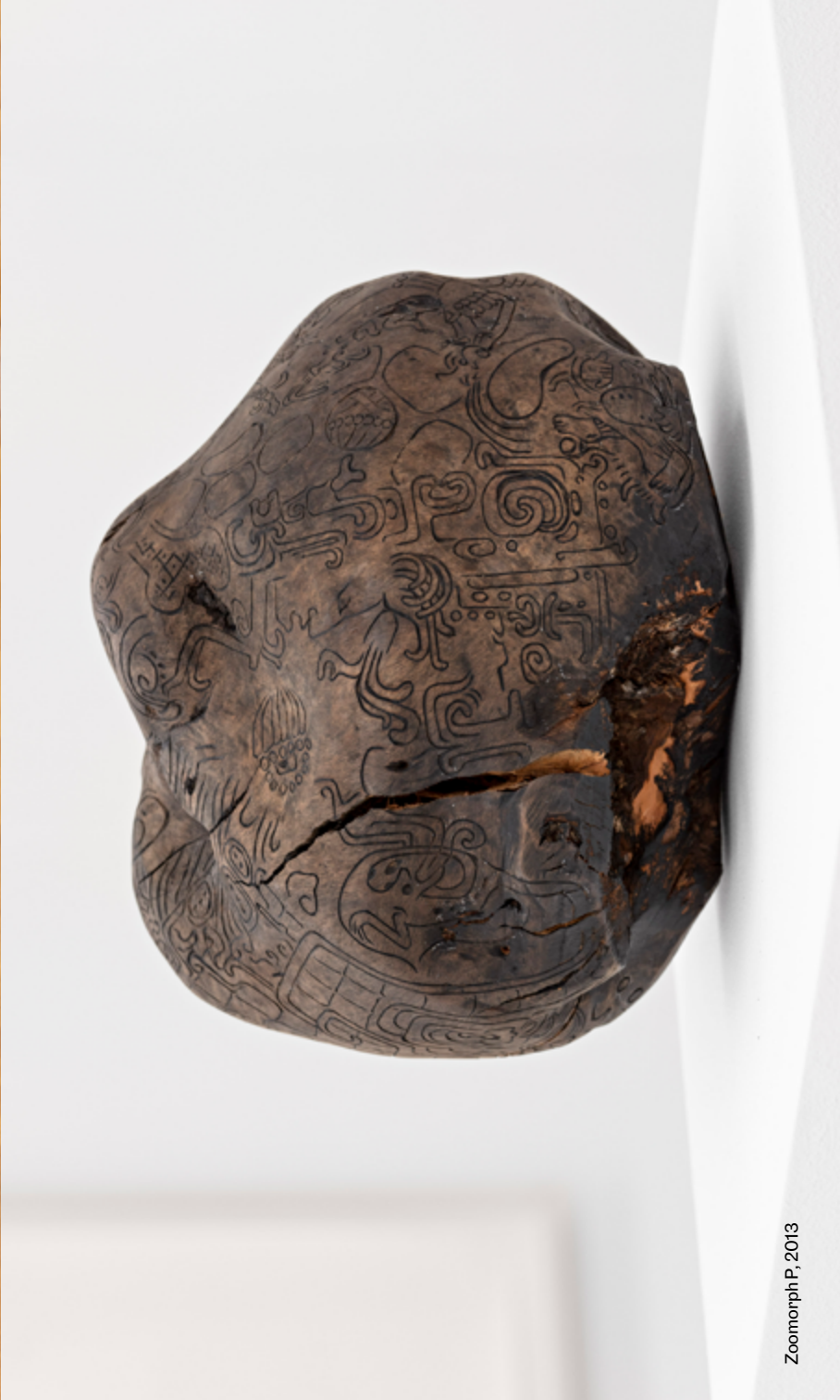
Zoomorph P, 2013