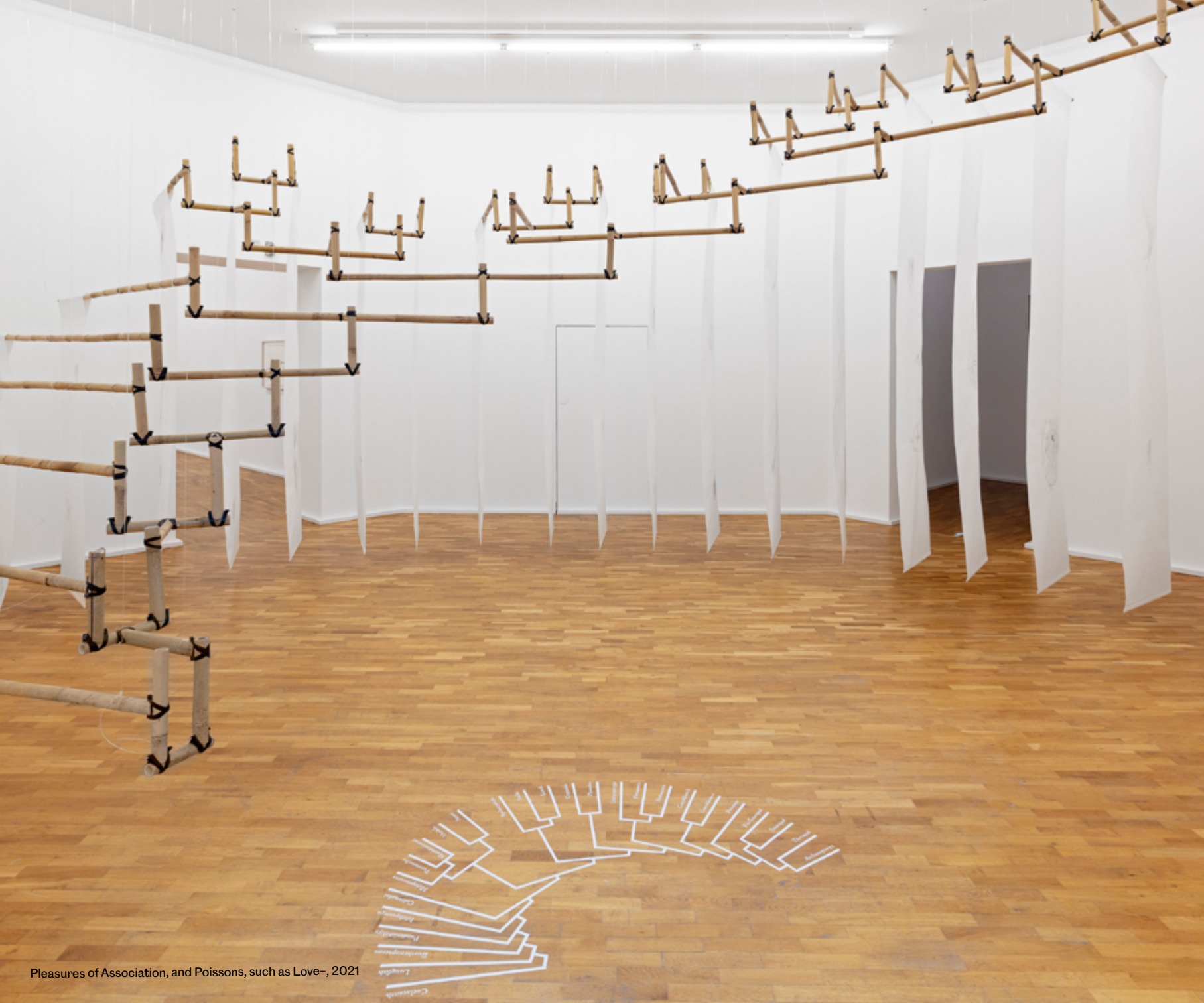
Pleasures of Association, and Poissons, such as Love-, 2021