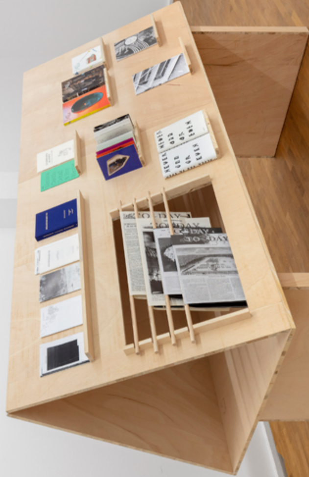
The world of words, 2001-2020